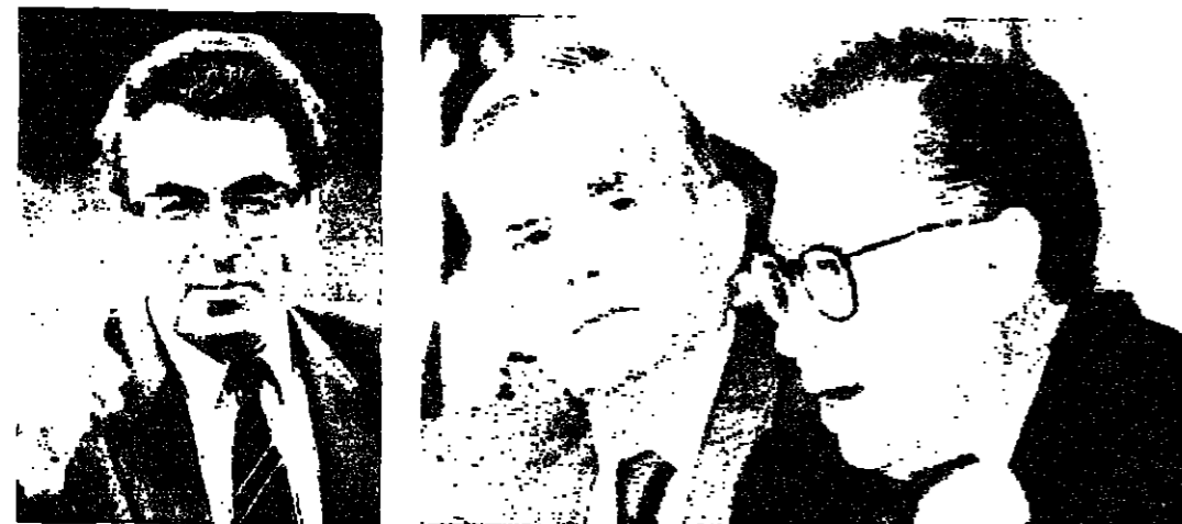
وزير خارجية المصدي وفي واشنطن، قال وزير الخارجية السوفييتي امس ان ضم العراق للكويت، وطالب بعمل جماعي في الخليج تحت اشراف الامم المتحدة. وقال بيان لوزارة الخارجية دون الخوض في تفاصيل، ان الامم المتحدة ينبغي ان تكون في صلب عملية حل النزاع بين الكويت والعراق.